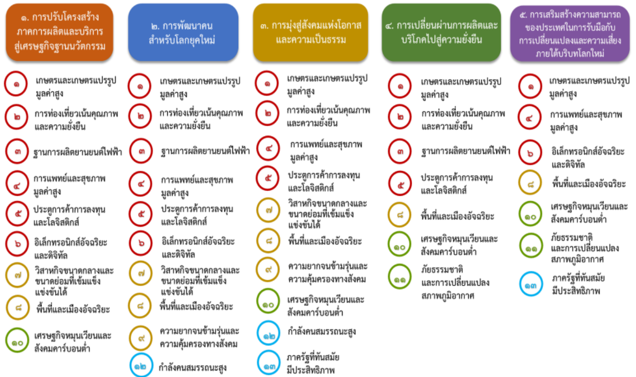
แผนภาพที่ ๓.๑ ความเชื่อมโยงระหว่างหมุดหมายการพัฒนากับเป้าหมายหลัก